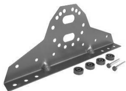
Комплект кронштейн снегозадержателя

Труба плоскоовальная 3 м – 2 шт Кронштейн универсальный Grand Line – 4 шт Саморез 8x60 мм – 8 шт ЭПДМ уплотнитель – 16 шт